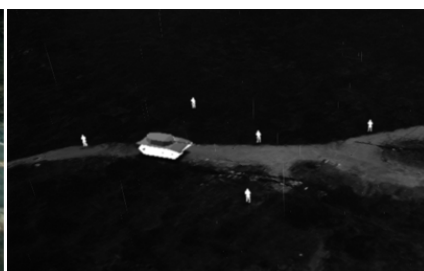
M2020, Solider IR