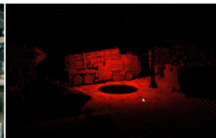
128ch. KN25 LiDAR