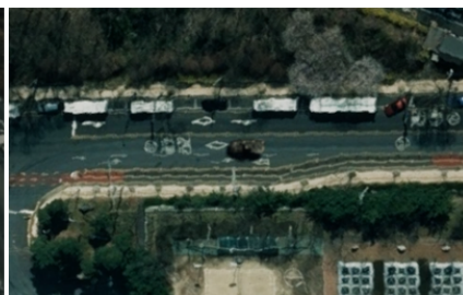
M2020 WAV EO